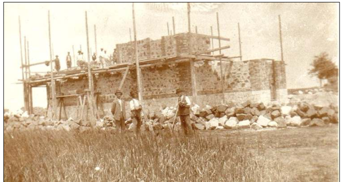
Az épülő templom