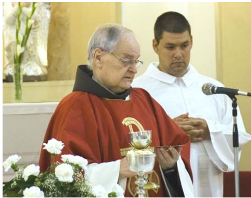
2014-ben Jászboldogházán misézett,