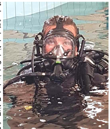
A kiképzési medencénkben bent a bázison

A szakaszom és így az én feladataim is kettősek, ugyanúgy helyt kell állnunk szárazföldön felderítőként, mint víz alatt. Sokszor vagyunk távol több napra vagy hetekre. Csak egy pár saját példát sorolva, ebben a beosztásban töltöttem éjszakát minusz 10 fokban 15 centi hóban a Mátrában, vagy épp másztam sziklát a Bükkben, de merültem az áradó Tiszában