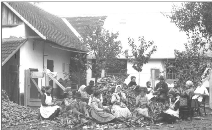
Kukoricafosztás régen. Illusztráció

A régi tanyasi emberek állattartással és földműveléssel foglalkoztak. A földműves szakmának sajátossága, hogy kora tavasztól ősziig nem sok szabad ideje van a benne dolgozóknak. Amikor viszont eljön az őszi, szép lassan elcsendesedik a határ, jön a tél a pihenés időszaka. Így van ez ma is, és így volt ez régen is. Az őszi munkák sorában az utolsók közé tartozott a kukoricafosztás. A régi világban az volt a szokás, hogy a kukoricacsöveket a csuhéval együtt törték le, és úgy vitték haza, otthon fosztották meg. A kukoricafosztás jó alkalom