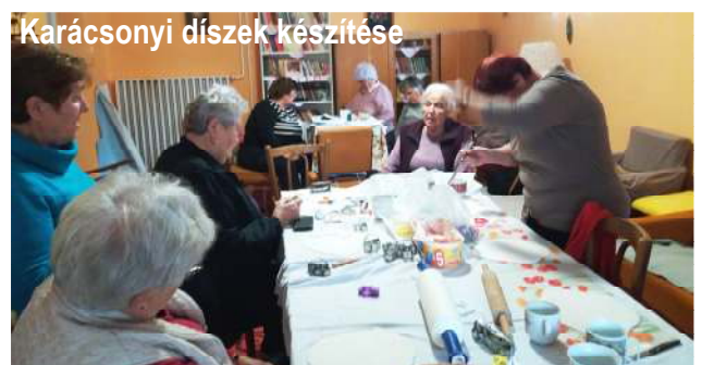
Karácsonyi díszek készítése