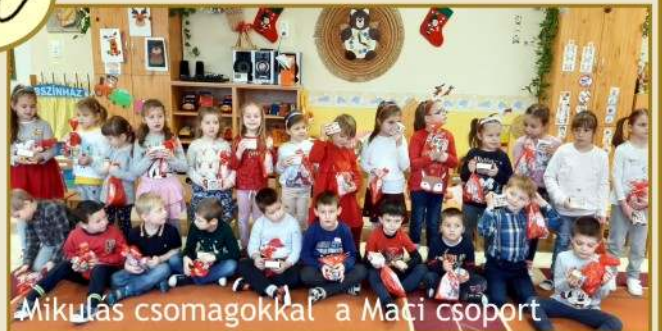
Mikulás csomagokkal a Maçi csoport