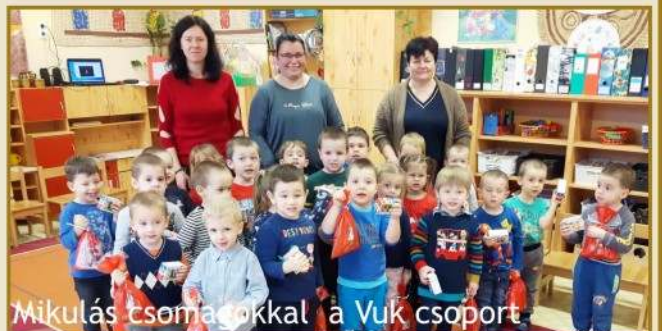
Mikulás csomagokkal a Vuk csoport