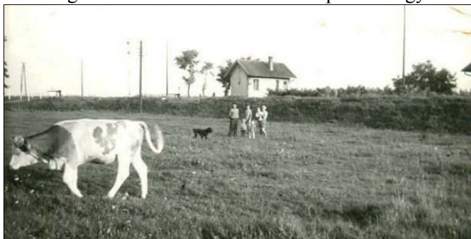
A 20-as őrház

idősebb férfiak kedvenc esti időtöltése volt ez. A tanya-csoport egyik találkozó, vagy ahogy manapság mondanánk, közösségi helye volt az őrház. A nagyapámmal jómagam is sokszor kísértéltem. A bakter megengedte, hogy a jelzőt vagy a sorompót én engedjem le, illetve nyissam fel. Természetesen akkor még kézzel, a föld alatt kialakított kis alagúton keresztül, hosszú láncsal, és vastag acélhuzallal történt a sorompó le- vagy fel-