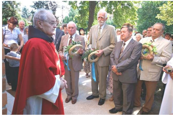
és felszentelte a Ferences vértanúk emléktábláját