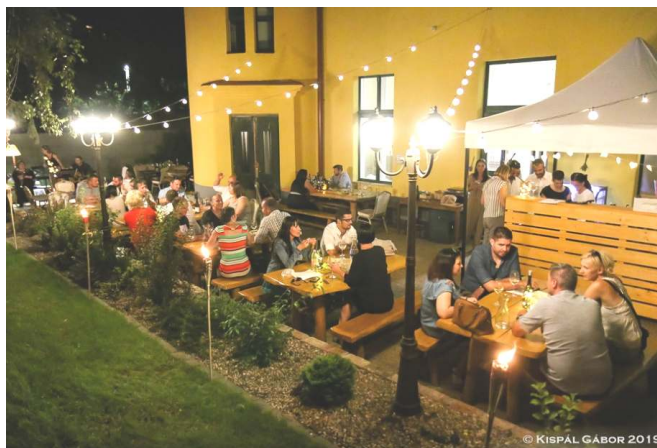
Hangulatos nyári este a Borudvarban

- A Borudvar saját vállalkozásom volt, egy állandó borkóstoló hely, ahol a korábban meghívott borászok bo-