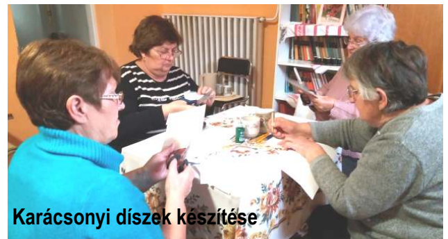
Karácsonyi díszek készítése