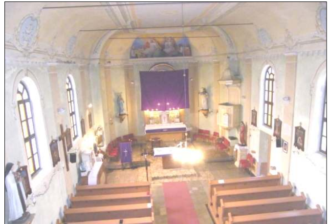
A templombelső a festés előtt. A mennyezet alatt vaspántok fogták össze a falakat.

A külső kivitelezési munkálatok 2013. szeptember 14-én kezdődtek, amit a jászapáti építőipari és szolgáltató kft. végzett. Megtörtént a tetőcsere, a mozgásukban korlátozottak számára akadálymentes bejutást biztosítottak, felújították a villanyhálózatot. 2014. július 10-re elkészült a templom teljes belső festése. A kisgyőri Király József képző- és iparművész tervei alapján szecessziós stílusú letisztult, meleg árnyalatú díszítések és egyházi témájú szimbólumok kerültek a