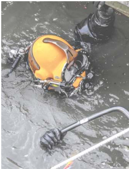
Munka közben nehézbúvár felszerelésben

A legtöbbször azonban 10 méter alatt merülünk, Magyarországon a legtöbb víz sekély. A nagyobb folyóink áradáskor mélyebbek, valamint a mesterséges bányavaink között vannak mélyebbek, ilyen kavicsbánya tavak vannak például Nyékládházán vagy akár Hegyes-