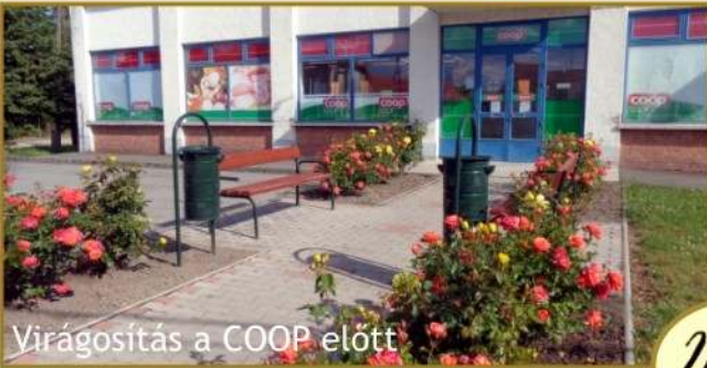
Virágosítás a COOP előtt