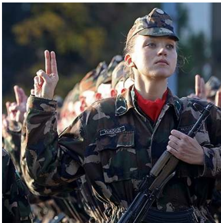
A katonai eskütételkor 2016 őszén Ez a kép a nap képe is volt a Honvédség hivatalos oldalán

Még ugyanabban az évben, 2016 nyarának végén bevonultam, 14 hetes alapkiképzése-