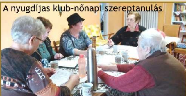
A nyugdíjas klub-nőnap szerezptanulás