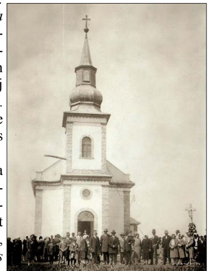
A templomszentelés 1930-ban