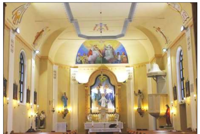
A megújult templombelső

A templomot 2014. augusztus 10-én az egri érsek jelenlétében szentelték fel. A lakosok örömmel fogadták a kívül és belül megújult, egyszerűségében is szép és bensőséges hangulatú templomot.