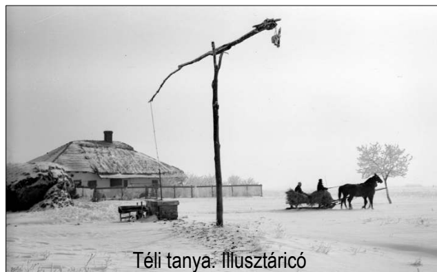
Téli tanya. Illusztráció

A szép lassan megrövidült nappalokkal jártak a napról napra hosszabb téli esték. Más szórakozási lehetőség hiányában elterjedt volt az esti kártyázás. A napi teendők elvégzése után a szomszédok összejöttek valamelyik tanyában, és a jól befűtött kemence mellett nagy kártyacsatáktól volt hangos a szoba. A felnőtteket mi, gyerekek is elkísértük, nekünk is volt kártyánk, de sokszor jobban szórakoztunk a felnőttek huncutságain, mert a petróleumlámpa általi félhomályban bizony előfordult, hogy egyik-másik szomszédasszony a szoknya alá rejtette valamelyik kártyalapot. Amikor ez kiderült, akkor aztán hatalmas nevetés, vidámság tört ki a társaságban. Általában a zsírozás ment, nagyokat csaptak a kártyával az asztalra, hangos kiáltásokkal adták egymás tudtára, kinek milyen lapja van. A kártyázás kiegészítője volt a tökmagolás. Délután a kemencében megpirult egy tepszi tökmag, amire jólesett a picéből előhozott tötevényi szőlő leve, ettől még nagyobb lett a hangerő, vele együtt a jókedv is.