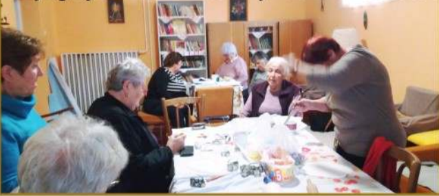
A nyugdíjas klub-karácsonyi díszek készítése