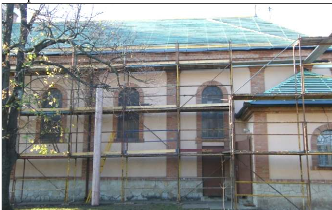
A tetőfelújítás 2013-ban

A tervek akkor válhattak valóra, amikor az egyház-község 2013-ban LEADER pályázat nyomán több mint 15 millió forint vissza nem térítendő támogatást nyert erre a célra az Európai Mezőgazdasági Vidékfejlesztési Alapból.