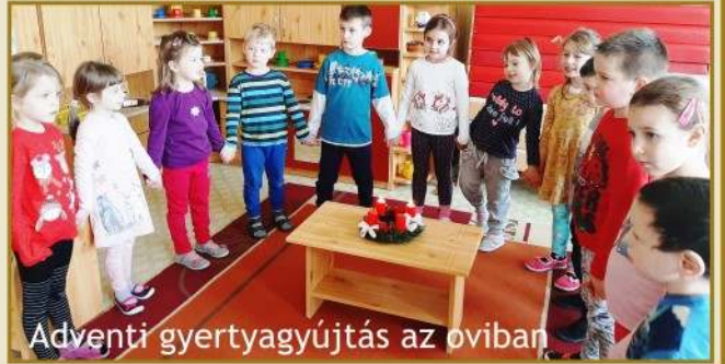
Adventi gyertyagyújtás az oviban